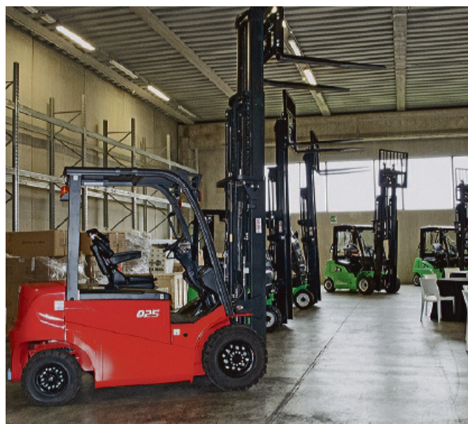
Sogema Group dispone di circa 50.000 metri quadrati di ampi magazzini organizzati e dislocati in aree di rilievo commerciale

gazzino, che vengono collaudate quotidianamente all'interno degli spazi aziendali. Sogema vanta un'ampia gamma di carrelli elevatori, che vanno dal transpallet elettrico, ai classici carrelli elevatori da magazzino, fino ad arrivare a carrelli adatti alla movimentazione di merce pesante, fino a 180 quintali di portata. Il marchio proposto dall'azienda di Ronco-