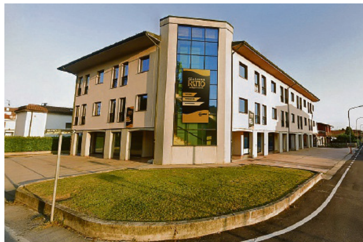
A sinistra la sede di Centro Studi Castelli di Castel Goffredo A destra Parco Giardino Sant'Apollonio, sede della Fondazione Senza Frontiere

La rivista RATIO , insieme a tutte le riviste "figlie" (per citarne alcune, Ratio Lavoro, Ratio Revisori e Sindaci, R-Evoluzione, Ratio Azienda, Ratio Nonprofit e molti altri prodotti dedicati) e al database omnnicomprensivo Ratio Sfera , rappre-