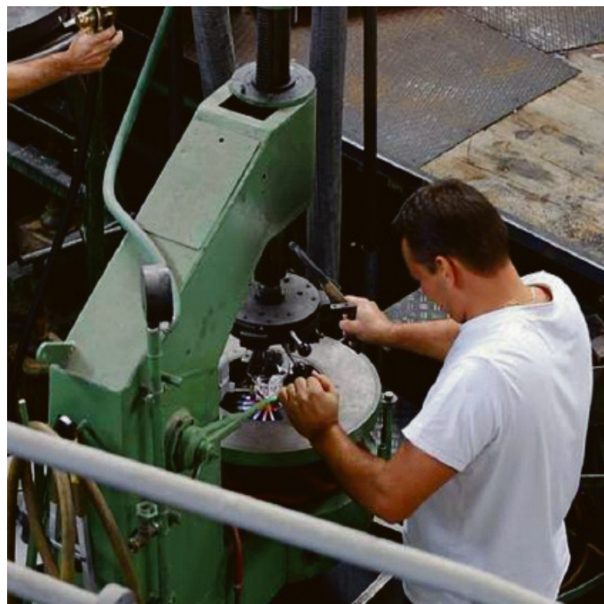
Api Risk si propone come consulente del rischio a 360°, offrendo soluzioni su misura per ogni realtà aziendale

Il servizio assicurativo rilancia un'assistenza a misura d'impresa