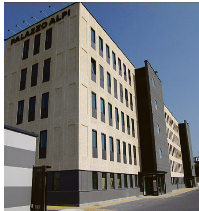
Palazzo Alpi, sede di Apindustria Confimi Mantova

Il corso per Energy Manager è in partenza il 26 marzo e sarà effettuato in diretta streaming per consentire alle aziende di seguirlo direttamente dall'azienda senza perdere tempo in trasferta. La durata prevista è di 40 ore e offrirà ai partecipanti tutte le competenze per gestire l'energia a livello azien-